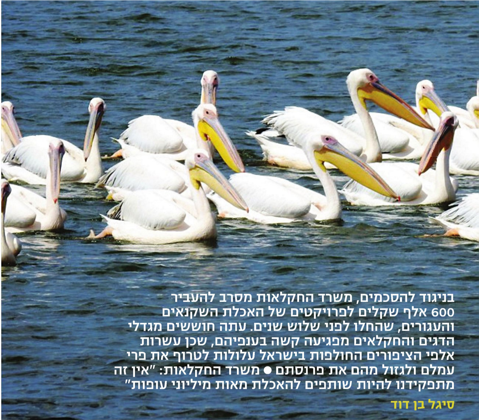
שקנאי בודד אוכל ביום קרוב לקילו דגים. שקנאים במאגר מים בשרון, בשבוע שעבר